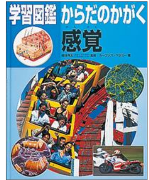
学習図鑑 からだのかがかく 感覚