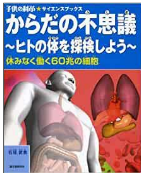
子供の科学★サイエンスブックス 休みなく働く60兆の細胞 からだの不思議 ヒトのからだを探検しよう