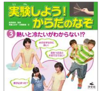
実験しよう! からだのなぞ ③ 熱いと冷たいがわからない!?