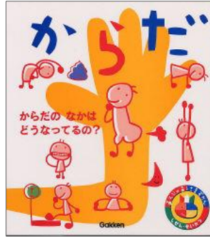
あそびのおうさまずかん・からだ