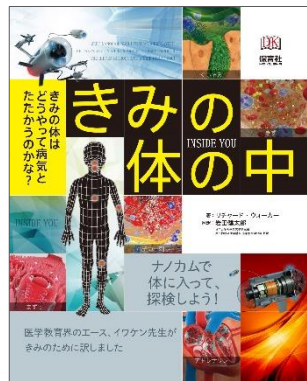
きみの体の中(INSIDE YOU) きみの体はどうやって病気とたたかうのかな?