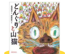
『どんぐりと山猫』 宮沢 賢治/作 田島 征三/絵 三起商行株式会社(ミキハウス)