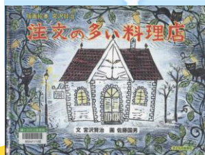
版画絵本宮沢賢治 『注文の多い料理店』 宮沢 賢治/文 佐藤 国男/画 子どもの未来社