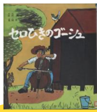
『セロひきのゴーシュ』 宮沢 賢治/作 茂田井 武/画 福音館書店