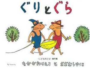
『ぐりとぐら』 中川 李枝子/さく 大村 百合子/え 福音館書店 E-オ