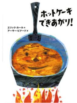
『ホットケーキできあがり!』 エリック・カール/作 アーサー・ピナード/訳 偕成社 E-カ