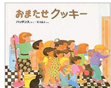
『おまたせクッキー』 パット=ハッチンス/作 乾 侑美子/訳 偕成社 E-ハ