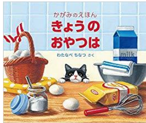
『きょうのおやつは かがみのえほん』 わたなべ ちなつ/さく 福音館書店 E-ワ