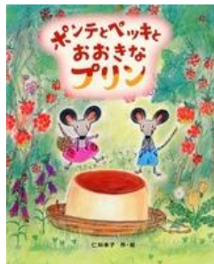
『ポンテとペッキと おおきなプリン』 仁科 幸子/作・絵 文溪堂 E-ニ