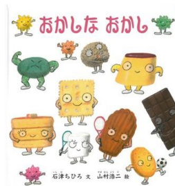
『おかしな おかし』 石津 ちひろ/文 山村 浩二/絵 福音館書店 E-ヤ