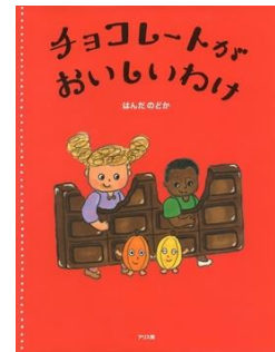
『チョコレートがおいしいわけ』 はんだ のどか/作 アリス館 E-ハ